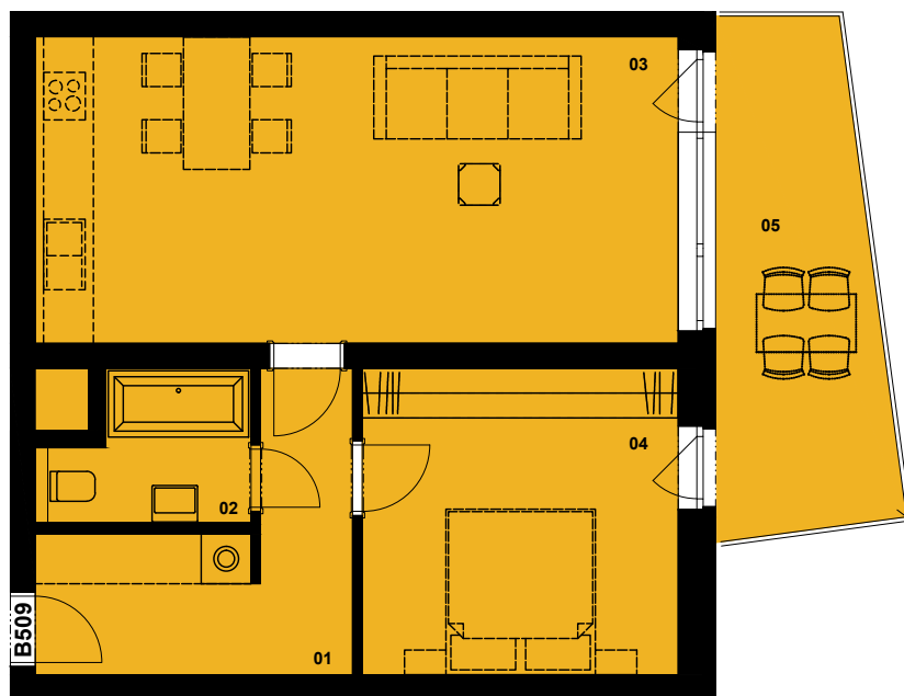
PŮDORYS 5.NP UMÍSTĚNÍ BYTOVÉ JEDNOTKY V RÁMCI PODLAŽÍ