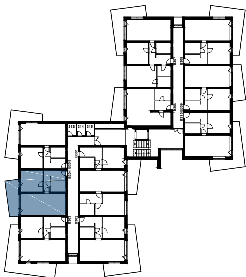
PŮDORYS 3.NP UMÍSTĚNÍ BYTOVÉ JEDNOTKY V RAMCI PODLAŽÍ