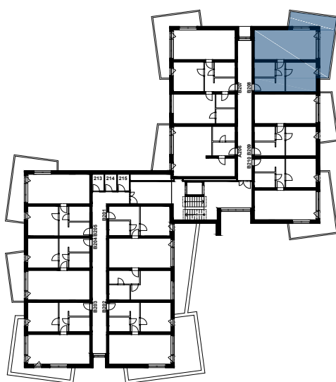
PŮDORYS 2.NP UMÍSTĚNÍ BYTOVÉ JEDNOTKY V RAMCI PODLAŽÍ